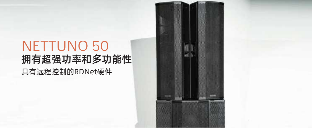
NETTUNO 50 TOP

Nettuno 50提供多种配置，以适应各种场地和表演风格。无论您选择带有一个TOP和两个SUB的单个系统，还是具有两个TOP和三个SUB的双系统，使用吊环螺栓的吊装配置，还是仅选择顶部的支杆式安装设置，Nettuno 50都能无缝适应您的性能需求。