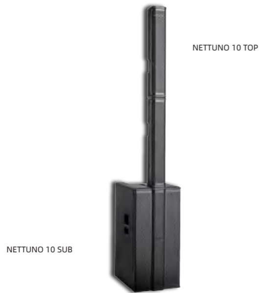
NETTUNO 10 SUB