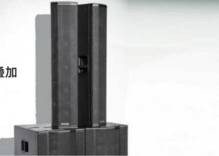
NETTUNO 20 TOP

当无法将扬声器系统放置在舞台地板上时，Nettuno 20可以放置在地面上，TOP箱体可以通过支杆安装在低音箱体的顶部，甚至可以悬挂。该系统的典型应用是当悬挂式线阵列系统在预算或技术手段上不合适时，用来覆盖大面积区域。